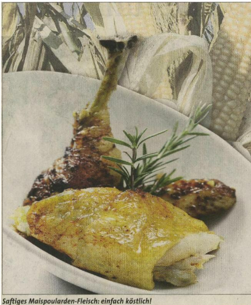
Saftiges Maispouларden-Fleisch: einfach köstlich!